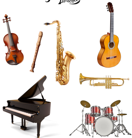
DES INSTRUMENTS DE MUSIQUE