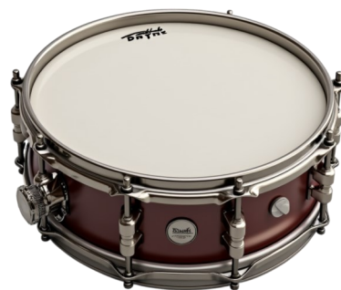
UNE CAISSE CLAIRE