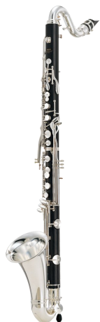
UNE CLARINETTE BASSE