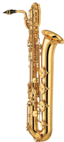
UN SAXOPHONE BARYTON