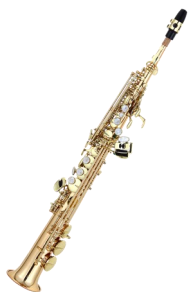
UN SAXOPHONE SOPRANO