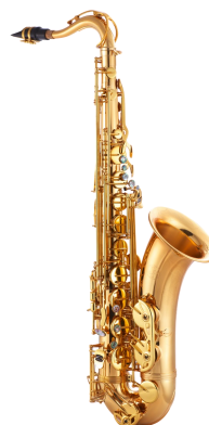
UN SAXOPHONE TÉNOR