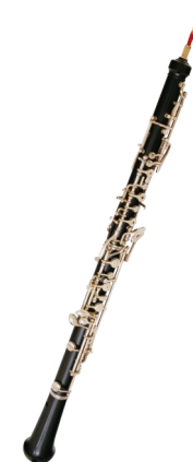
UN COR ANGLAIS