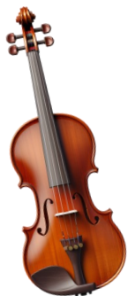
UN VIOLON ALTO