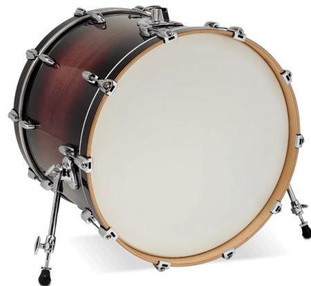
UNE GROSSE CAISSE