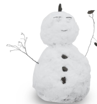
UN BONHOMME DE NEIGE