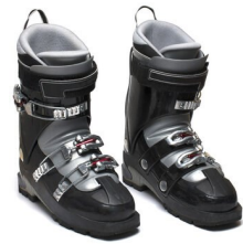
DES CHAUSSURES DE SKI