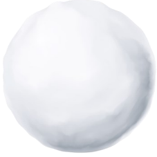
UNE BOULE DE NEIGE