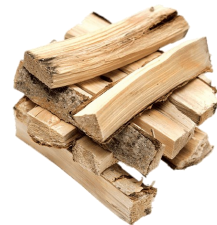
DU BOIS DE CHAUFFAGE