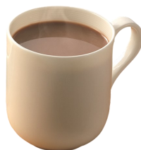
UN CHOCOLAT CHAUD