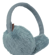
UN CACHE- OREILLES