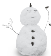
UN BONHOMME DE NEIGE