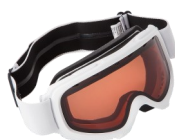
UN MASQUE DE SKI