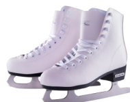
DES PATINS À GLACE