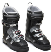
DES CHAUSSURES DE SKI