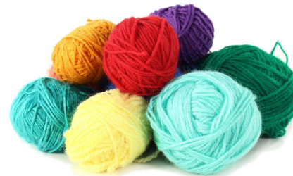
DE LA LAINE