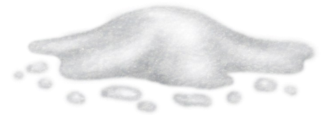
DE LA NEIGE